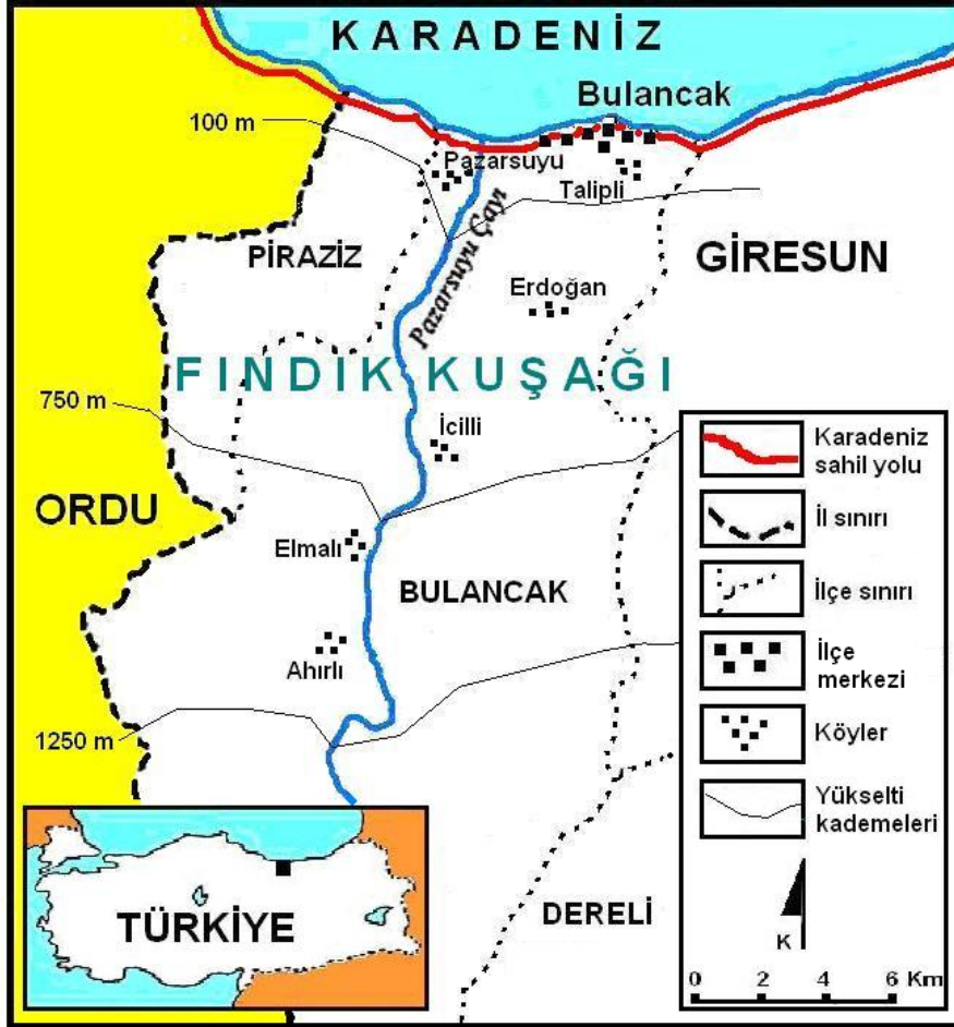
Şekil 1: Araştırma sahası.

burada bulunan Erdoğan ve İcilli köylerini, üçüncü kademe ise 750-1250 m'ler arasını ve burada bulunan Elmalı ve Ahırlı köylerini kapsamaktadır (Şekil 1).