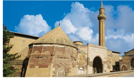
Fotoğraf 3: Sungur Bey Cami (İlhanlılar Dönemi, 1335) (Sever ve Kopar, 2014, s. 169)