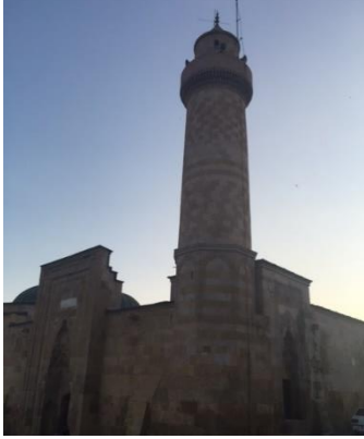
Fotoğraf 2: Alaeddin Cami (Selçuklular Dönemi, 1223) (Orijinal, 2015)