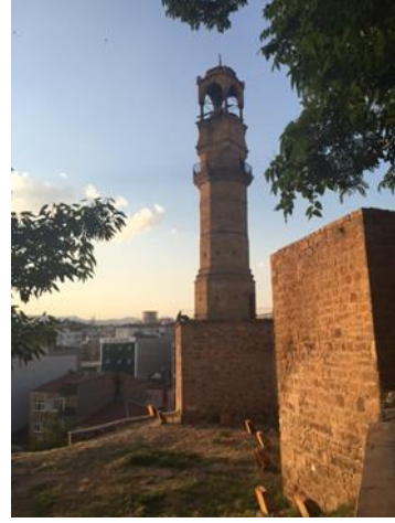
Fotoğraf 5: Niğde Saat Kulesi (Osmanlı Dönemi 1901–1902) (Orijinal, 2015)

Kent içinde farklı dönemlere ait bulunan eserlerden dönemin Niğde'si hakkında çıkarımlar yapılabilmektedir. Genel olarak merkezde farklı dönemler için çıkarımlar yapılabilecek en etkili eserler Selçuklu, İlhanlı, Karamanoğulları ve Osmanlı dönemi eserlerdir. Selçuklu döneminde Niğde, kuzeyde bir iç kale ve güneye doğru genişleyen dış kale surlarıyla kuşatılmıştır. Selçuklu döneminden günümüze kale içinde yer alan Alaeddin Camii (1223) ulaşmıştır. İlhanlı döneminde ise Niğde Sungur Bey Camii ve Türbesi (1335) inşa edilmiştir. Kentin en büyük boyutlu yapısı Karamanoğulları dönemine ait Ak Medrese (1409)'dir. Niğde'deki Selçuklu, İlhanlı ve Karamanoğulları dönemlerinde yapıların inşa edildiği 1223- 1410 yılları arasındaki yaklaşık 200 yıllık süreçte özellikle taç kapı, pencere, kemer, tonoz ve mihrap gibi mimari öğelerde Gotik etkiler görülür. Niğde'deki Alâeddin ve Sungur Bey camileri ile Ak Medrese de yabancı etkiler gözlemlenir. Bu yabancı etkilerin (Romanesk, Gotik, Ermeni vb.) kaynağı ise tartışmalıdır (Şaman, 2013, s. 115).