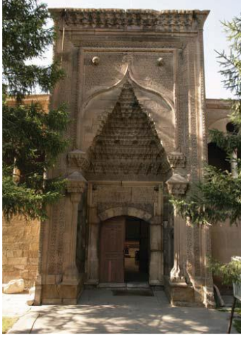
Fotoğraf 4: Akmedrese (Açıkgöz vd., 2009, s. 104) (Karamanoğulları Dönemi 1409)