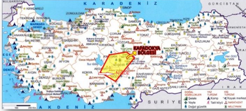
Harita 1: Kapadokya Bölgesi İçinde Niğde (Sever ve Kopar, 2014, s. 159)

Bir yerleşmenin kurulup gelişmesi doğal çevrenin yerleşme birimine sağladığı imkânlara ve kaynaklara bağlıdır. Dolayısıyla yerleşmelerin ortaya çıkıp gelişebilmesi için öncelikle doğal çevre faktörlerinin elverişli bir ortam oluşturması gerekmektedir (Toroğlu, 2009, s. 173). Bu açıdan Niğde kenti oldukça şanslı bir yerdedir. Kent arazisinin bir kısmı İç Anadolu Bölgesi'nde, bir kısmı ise Akdeniz Bölgesi'nde yer alır. Kent kurulum alanının batı kesimi dalgalı düzlükler, kuzey, güney ve doğu kesimleri ise dağlık alanlarla kaplıdır. Güney ve güneydoğu sınırlarını Orta Toroslar'ın temeli niteliğindeki Bolkar Dağları (3002 m) ve onun uzantısı biçiminde olan Aladağlar (3734 m) kuşatır (Sever ve Kopar, 2014, s. 14). Kentin civarında bulunan Misli, Melendiz, Altınhisar Ovaları, Çamardı Ecemiş, Çiftlik Nar ve Niğde Karasu Vadileri ile Karasu, Melendiz Çayı, Ulurmak ve Çakıt Çayları bölgeye hareketlilik kazandırır. Ayrıca Aladağlar ve Bolkarlar üzerinde buzul aşınmasıyla oluşan göller de mevcuttur. Genel olarak karasal iklimin hakim olduğu bölgeye az miktarda yağış düşmesinden dolayı bölgede ormanlık alan azdır. Bölge yeraltı madenlerince zengin olup, sıcak su kaynakları çoktur.