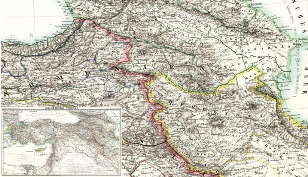
Harita 4: 1872 Tarihli Handatlas'ta Anadolu'nun doğusu ve Armenian adı verilen bölge.