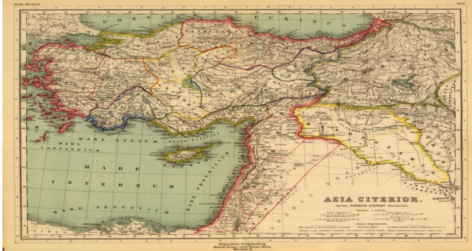
Harita 2: Asia Citerior. (Kaynak: www. history-of-macedonia.com ).