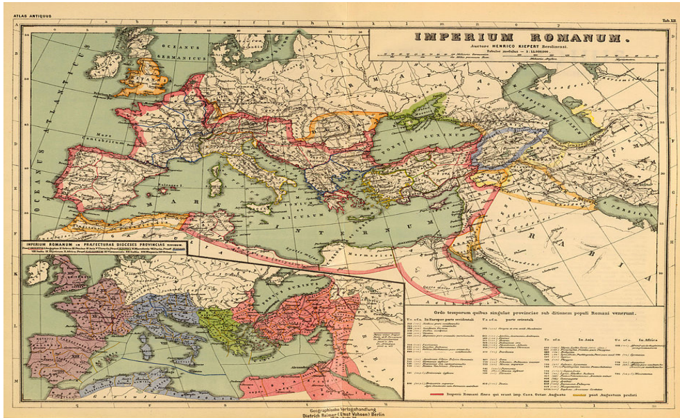
Harita 6: 1872 Tarihli Atlas Antiquus'ta Anadolu'nun doğusu ve Armenian adı verilen bölge.