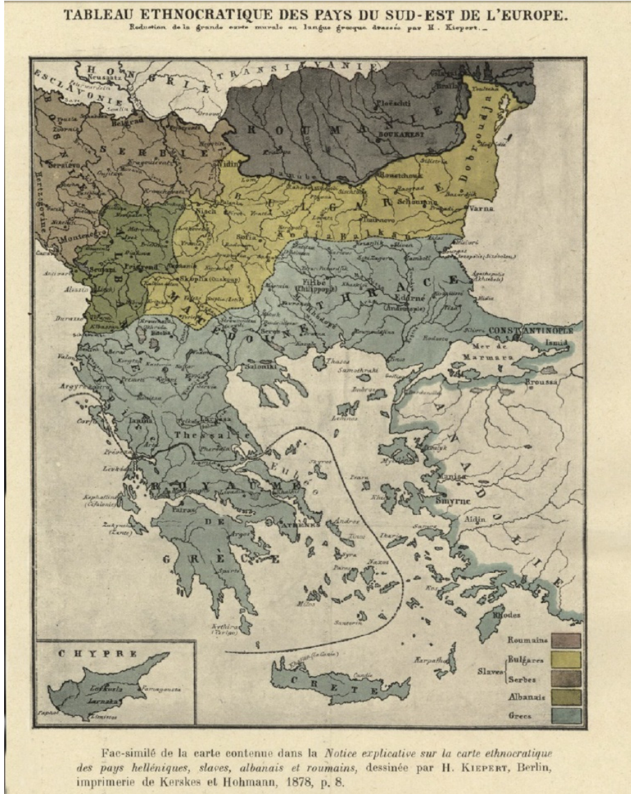
Harita 1: Kiepert'in Balkanlar ve Batı Anadolu Etnik Dağılım Haritası.

birimlerinde kadın ve çocuk nüfusun sayılması durumunda Türk ve Müslüman nüfusun çok çocuklu yapısıyla Rum, Ermeni ve Yahudi nüfusun toplamını geçeceği de aşikârdır.