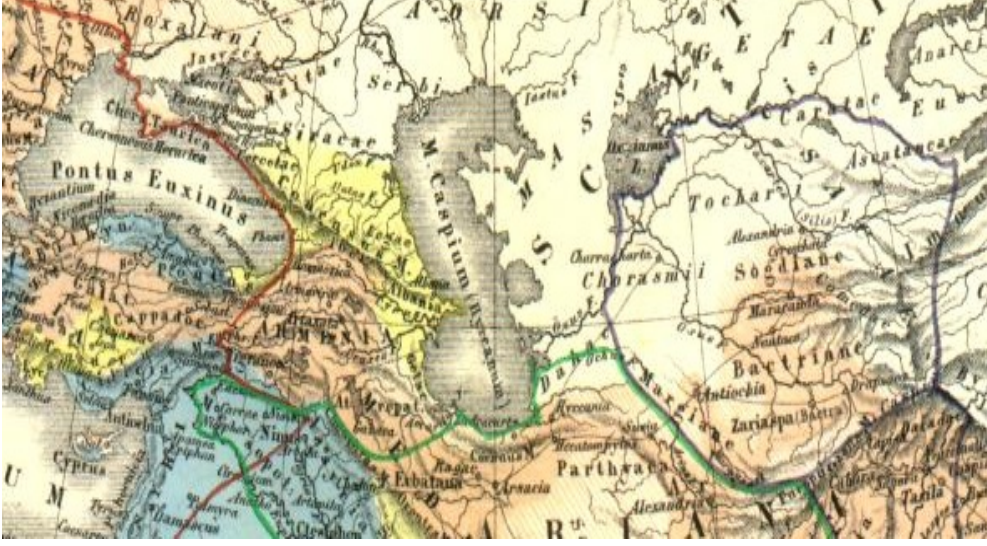
Harita 3: Orbis Terrarum Antiquis Notus'ta Anadolu'nun doğusu ve Armenia adı verilen bölge.