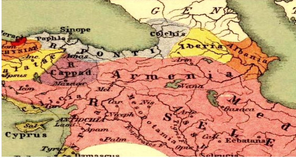
Harita 7: 1903 Tarihli İmperia Persarum- Macadenum'da Anadolu'nun doğusu ve Armenia.

Her şeye rağmen haritalar çizilmiş ve çeşitli tarihlerde yayımlanmıştır. Sonuç ise Ermenilerin Batılı emperyalist güçlerin desteğiyle ayaklanmaları, tedhiş hareketlerine girişmeleri, Anadolu'nun özellikle doğusunda ve Azerbaycan'da Türklere karşı katliamlar yapmaları olmuştur. Milli Mücadele'nin zaferle sonuçlanmasıyla Batı'nın Türkiye üzerindeki emelleri ve Ermenilerin Kiepert tarafından sınırları çizilen Ermenistan hayalleri gerçekleşmemiş ancak ertelenmiştir. Bununla birlikte adı geçen haritalar ve daha sonraki zamanlarda çizilen haritalar Batılı devletlerin bölgeye yönelik amaçlarının ve Ermeni tezlerinin tarihi vesikaları olarak günümüzde hala kullanılmaktadır. Bu tezleri sürekli gündemde tutan Ermenistan, hem Türkiye'ye hem de Azerbaycan'a her fırsatta gerek siyasi ve diplomatik gerekse terörizmi desteklemekten ve askeri saldırılar yapmaktan çekinmemektedir. Onlarca yıldır bir Azeri toprağı olan Karabağ'ı işgal altında tutmakta, Türkiye'den toprak talep etmektedir.