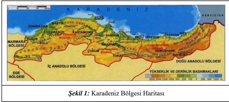
Şekil 1: Karadeniz Bölgesi Haritası

Bölge, batıda Sakarya Nehri'nin doğusu, doğuda Gürcistan sınırı arasında yer almaktadır. Ülkemiz bölgeleri arasında 146.178 km 2 alanıyla yüzölçümü büyüklüğü bakımından 3. sırada yer almaktadır. Doğu Karadeniz kesimi engebeli ve yüksek dağlık alanlardan oluşmaktadır.