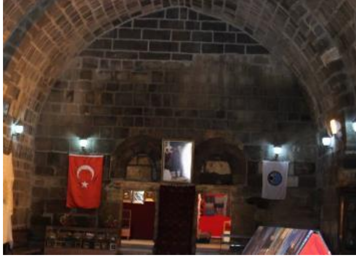
Fot. 11: Orta Mekânın Batı Ucunda Yer Alan Odalar.