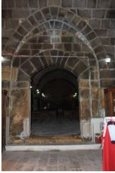
Fot. 17: Kuzey Mekân Giriş Kapısı.