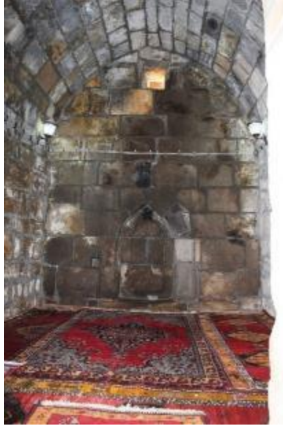
Fot. 7: Mescit İç Mekânı.