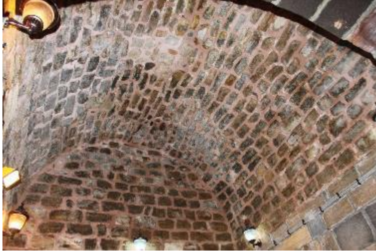
Fot. 10: Kuzey Hücresinin Üst Örtüsü.