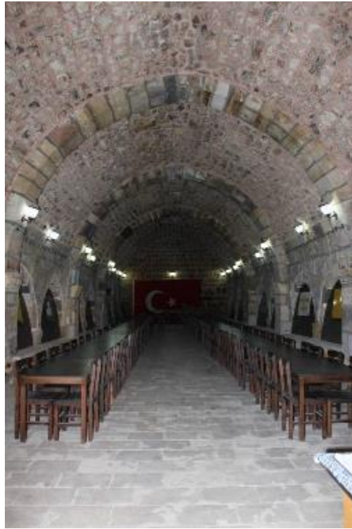
Fot. 16: Güney Mekân.