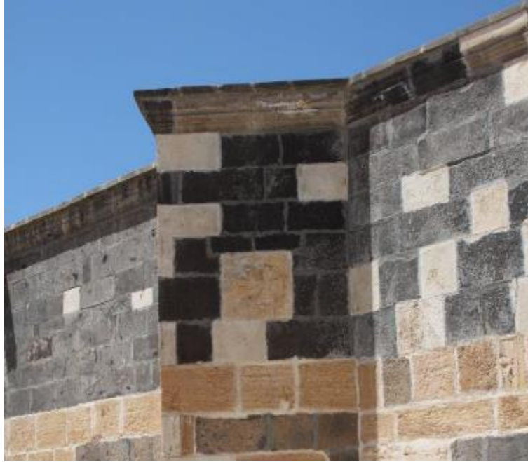
Fot. 20: Dış Cephede Bulunan Devşirme Malzemelerin Bir Örneği.