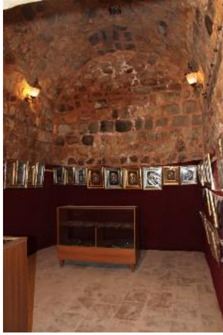
Fot. 13: Odaların Üst Örtüsü.

Sultan Murat Topçu Sivas Kangal-Alacahan Kervansarayı (Bir Tarihlendirme Denemesi) Alacahan Caravanserai in Kangal, Sivas (An Attempt of Dating)