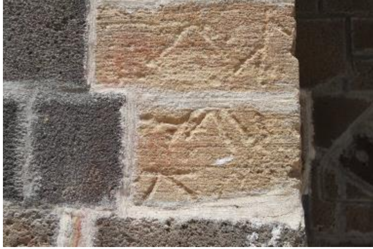
Fot. 19: Taşçı İşaretleri.