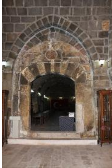
Fot. 14: Güney Mekân Giriş Kapısı.