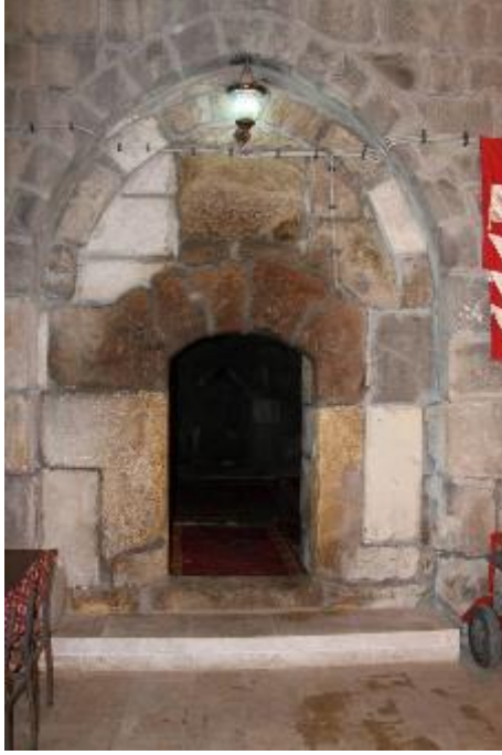
Fot. 6: Mescit Giriş Kapısı.