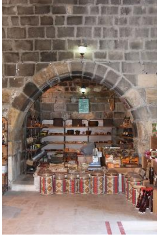
Fot. 9: Mescidin Kuzeyinde Bulunan Hücre.

Sultan Murat Topçu Sivas Kangal-Alacahan Kervansarayı (Bir Tarihlendirme Denemesi) Alacahan Caravanserai in Kangal, Sivas (An Attempt of Dating)