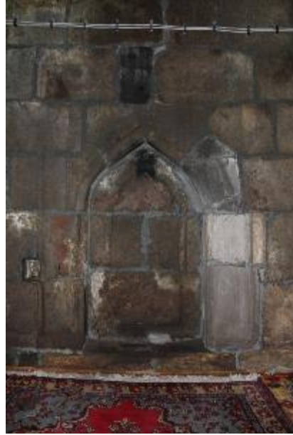
Fot. 8: Mihrap.