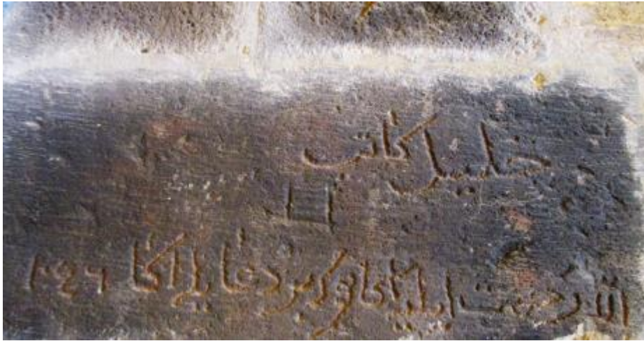
Fot. 4: Katip Halil İmzalı Yazıt.