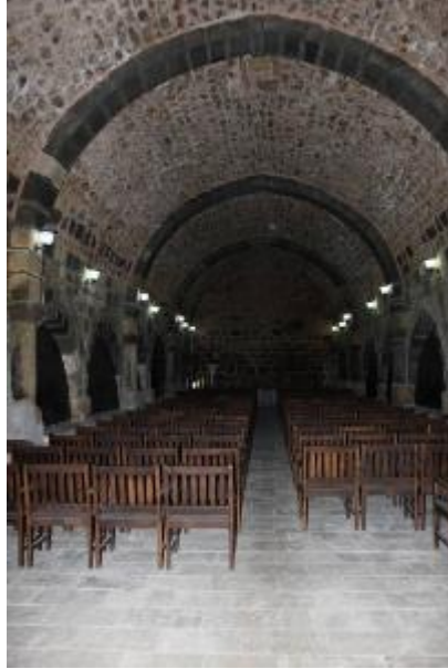
Fot. 18: Kuzey Mekân.