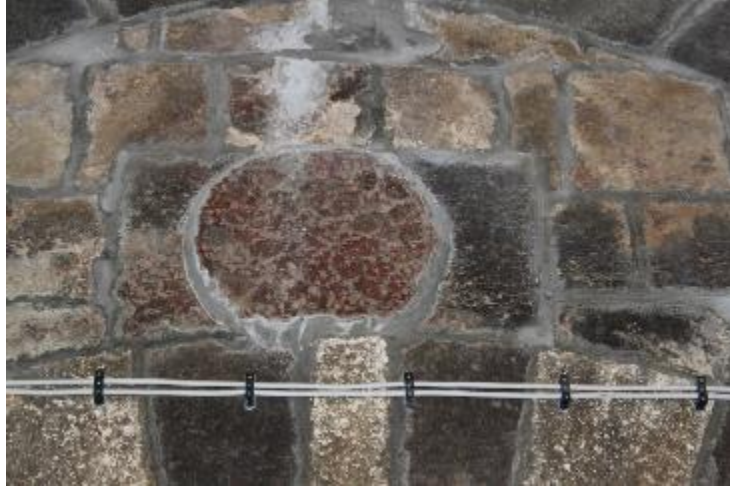
Fot. 15: Güney Mekân Giriş Kapısı Üzerinde Bulunan Madalyon.