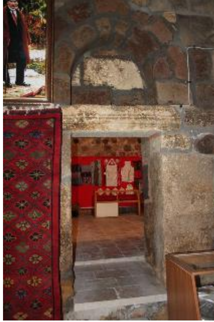
Fot. 12: Oda Giriş Kapısı.