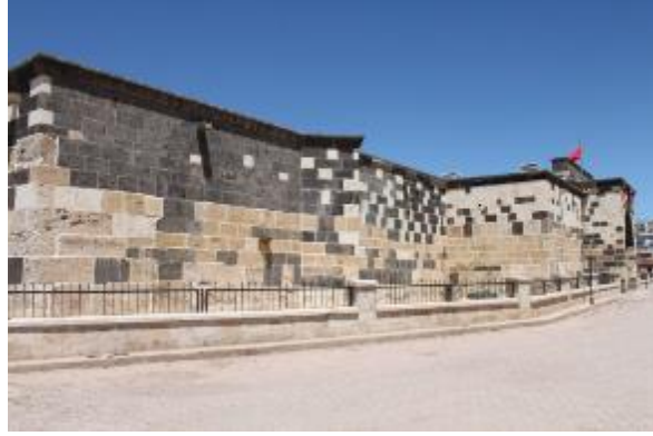
Fot. 1: Alacahan Kervansarayı.