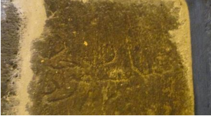
Fot. 5: Orta Mekânın Kuzey Duvarı Üzerinde Bulunan II. Yazıt.

Sultan Murat Topçu Sivas Kangal-Alacahan Kervansarayı (Bir Tarihlendirme Denemesi) Alacahan Caravanserai in Kangal, Sivas (An Attempt of Dating)