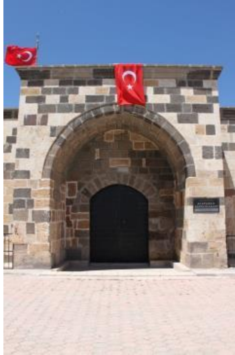
Fot. 2: Hanın Girişi.