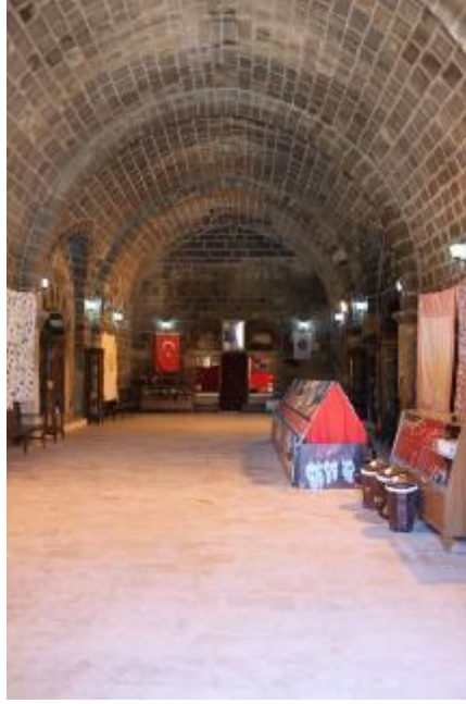
Fot. 3: Giriş Mekânı.